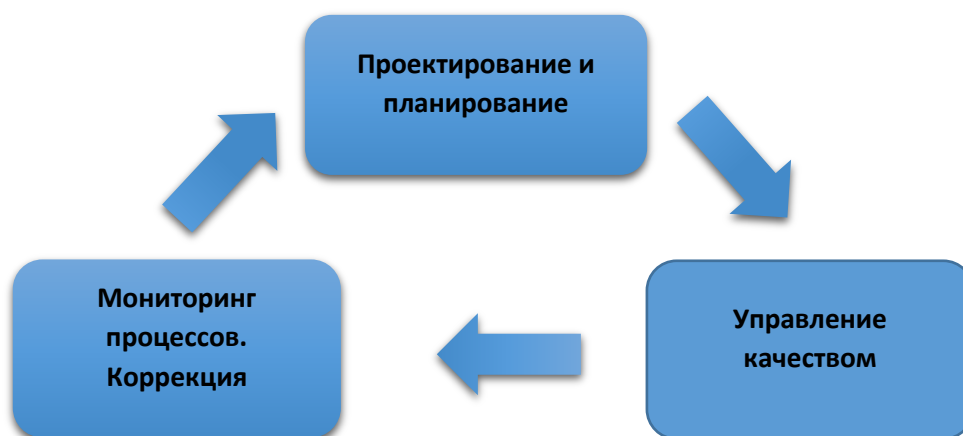
Схема 1. Треугольник управления качеством (модель управления качеством)

Система управления качеством образования представляет собой непрерывный замкнутый процесс, состоящий из взаимосвязанных и взаимообусловленных элементов (схема 1).